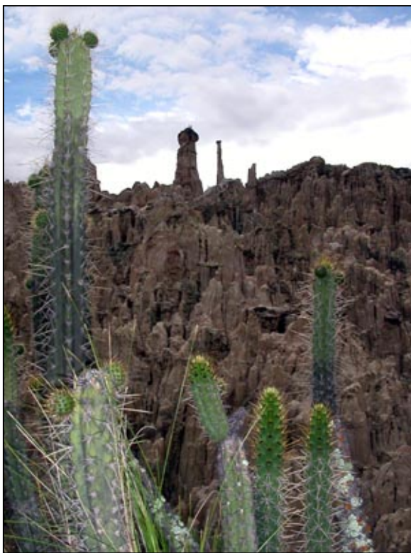
Steinformasjonene i Valle de Luna ligner mye på kaktusene som gror der.

insektslignende fugl som stod stille i luften og drakk nektar av blomstene. Vi forsøkte å forklare på et sparsom spansk for vekten hva vi hadde sett. "Rabbit?" svarte vekten. Vi gikk da over til et mer intenst fingerspråk og fikk nytt svar: "Giant Hummingbird!" ("kjempe-kolibri"). At vi er i tropene fikk vi ytterligere bekreftet da vi besøkte dyrehagen like ved. Der lå løvene og dovnet seg, flamingoene stod på stive ben i en dam og fargerike papegøyer og spretne apekatter skrek til