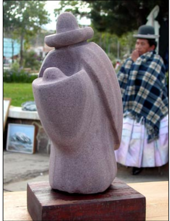
Modell og skulptur?

M arkedene er fargerike og svært fotogene, men et godt råd fra lokalkjente er å la kamera ligge. Folk liker ikke å bli fotografert eller tapet på video. Noen vil kreve penger for å bli avfotografert, andre gir uttrykk for at de misliker å få en fotolinse opp i nesen. Begrunnelsen kan være at man er fattig, men like fullt stolt og ikke ønsker å være et fotoobjekt. Fortsatt lever dessuten den forestillingen at en ved å bli fotografert, kan bli frarøvet sjelen. Så det ble altså ikke mange bilder fra Markedet. Det jeg kunne ha fotografert var: Stolte kvinner i Aymara-indianernes drakt som man gjerne gjenkjenner på grunn av den lille "bowlerhatten" på toppen. Sekker med krydder i alle farger, grønnsaker og frukt i store mengder og av svært høy kvalitet. Skopussere som skjuler ansiktet med finlandshetter for ikke å bli gjenkjent mens de gjør sitt arbeid som er det lavest ansette ved siden av å være prostituert. Jeg kunnet også ha fotografert inntørkede lamafostre som legges under grunnmuren når det skal bygges et nytt hus for å bringe lykke.