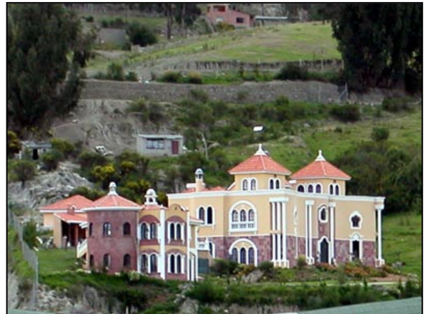
Forskjellen på høy og lav, rik og fattig er betydelig i Bolivia.

Det er kanskje heller ikke å undres over at noen velger å være lommetyver og robbe oss turister som kommer hit med våre lommebøker og kameraer. Det kan jo lønne seg. Jeg opplevde et slikt forsøk da vi gikk i sentrum en kveld. I en utvendig bukselomme med lukking hadde jeg et lite digitalkamera. Den lille banden på 3-4 personer hadde opplagt oppdaget at det var noe der, og satte i gang sitt innøvde spill. Avledningsmanøveren denne gangen var en