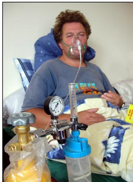
Mathisen har slått seg på flaska og blitt en form for periodepuster.

Med sviktende spanskkunnskaper og en lys lugg får en stadig spørsmålet, - Sois americanos? (Er du amerikaner?) Man spør altså ikke om hvor en er i fra, man antar at man er en gringo på grunn av utseende. Og er du en gringo , er du ikke særlig godt ansett. Under opptøyene i oktober var amerikanerne opplagt en utsatt gruppe, og når vi vandret på markedene i La Paz, kunne vi kjenne litt tunge blikk i ryggen. Særlig vakte de solblekede luggene til guttene oppsikt, og de var ikke helt sikre på om de likte det. Det kom opplagt an på hvem som snudde seg og glodde... Men er man ikke en gringo , men derimot en Noruego , hender det ikke sjelden at det brer seg et smil ut over ansiktet til den som spør. Noruega har opplagt en god klang her i La Paz, ikke minst på grunn av det arbeidet Misjonsalliansen har utrettet.