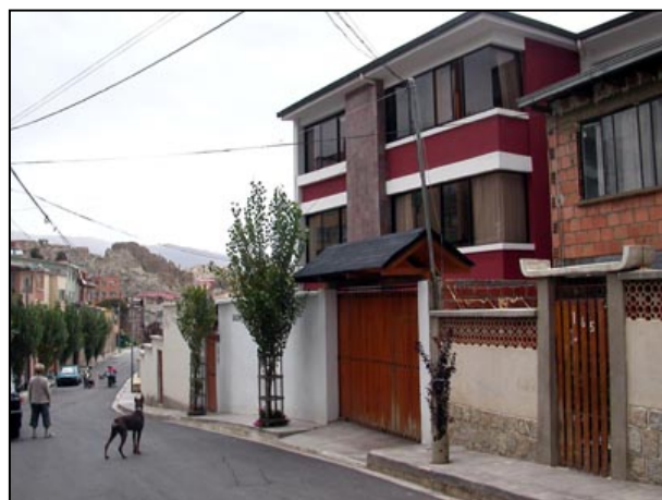
Casa Alianza ligger i et middelklassestrøk med væpnede vakter i gaten om natten. Et paradoks, - og en dyd av nødvendighet.

for det en finner hjemme på EL-kjøp. Forskjellen er at prisen er den halve, noen ganger bare ¼ av den en er vant med. Men en må være oppmerksom på at det selges både ekte varer og piratkopier. Det synes imidlertid som om selgerne er ærlige med hensyn til forskjellen mellom det som er ekte og det som er "fakede" produkter. Da guttene kjøpte et kopiert spill til ¼ av