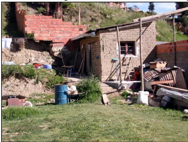
Her bor den unge parkeringsvakten sammen med sin familie på seks.

steinhuggere og hugget ut tradisjonelle motiver fra Bolivia.