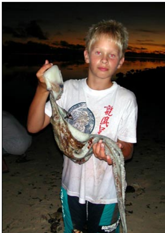
Denne blekkspruten fikk jeg av en kompis. Den er 1 meter lang.