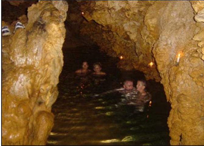
Vi badet i denne hulen. Jeg frøs selv om det var 22 grader i vannet.

Er ikke det litt sprøtt? Da vi landa fikk vi blomsterkrans rundt halsen og vi ble kjørt til hytta hvor vi skulle bo.