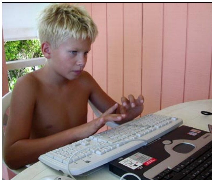
Her arbeider jeg med reisebrevet til dere. Det er OK å ha skole i tre timer.