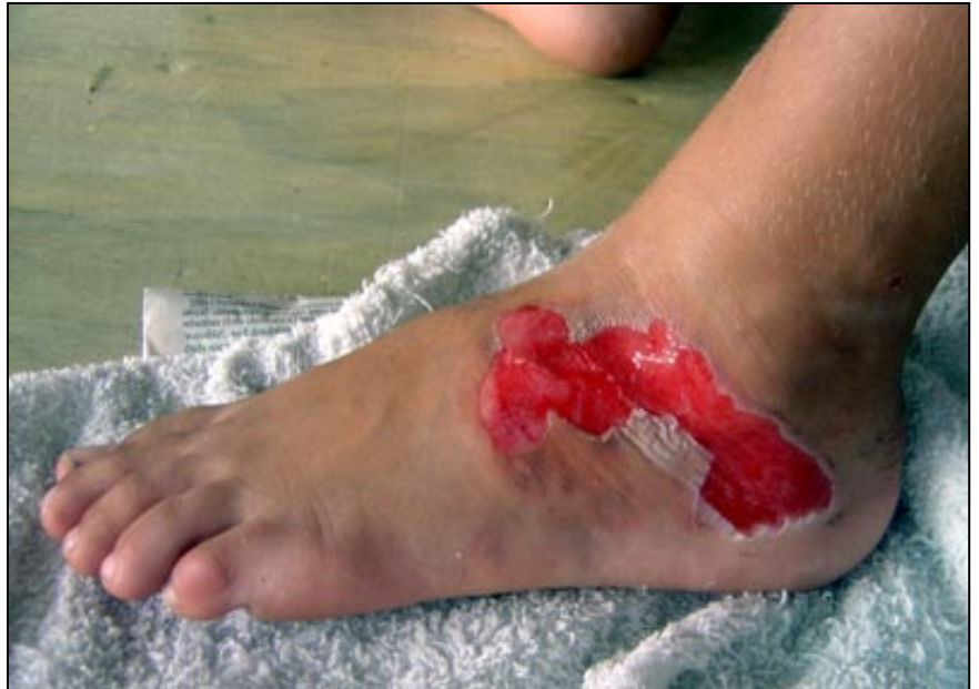
Slik så bannsporet ut 3 dager etter at jeg brant meg.

Grillfest er noe av det gøyeste jeg vet. Men denne grillfesten gikk fra den beste til en av de dårligste dagene i mitt liv. Den begynte slik: Vi hadde invitert 15 norske og 1 lokal. Alle var invitert til å spille volleyball og spise grillmat. Vi spilte volleyball og alt gikk som planlagt helt til grillingen starta. Det var sent. Vi gikk og så på småkrabber. Det var et par norske tvillinger der. Vi hadde gått ganske langt i strandkanten og var på vei mot barbecueplassen. For å komme dit måtte vi over et to dager gammelt bål. Jeg gikk med sandaler på, men det gjorde ikke tvillingene. Jeg begynte å gå over