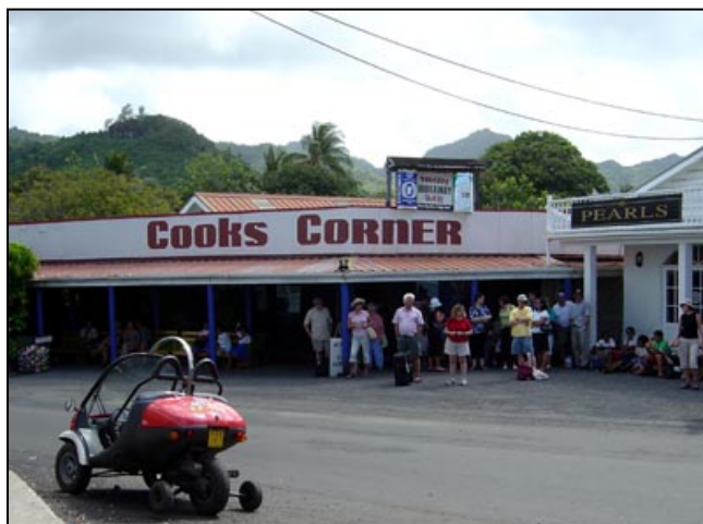
Cooks Corner i sentrum av Avarua er knutepunktet for all busstrafikk på øya.

Du kjenner gjerne nybegynnerne igjen på noen skrubbsår, bøyde speil og en "Island Tattoo". Det er brannsåret en får dersom en går av på feil side av mopeden og legger leggen inntil det varme eksosrøret. Det er det så mange som gjør at det altså er blitt et slags tatovert visittkort fra øya. Alle kjører moped. Enkelte er så digre her nede at de formelig pakker inn mopeden med kropp på alle kanter, og det er bare den putrende lyden og de to hjulene som forteller at det er en mopedist. Småbarn sitter bakpå sammen med mor, og er for sikkerhets skyld knyttet fast til henne med en pareau slik at de ikke faller av når de sovner, - for sovner gjør de inntil ryggen til mor.