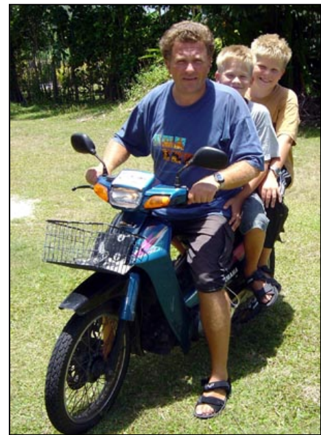
Tre herrer på to hjul = en for mye.

Vi kan ikke riktig huske hvor vi så plakaten, men den handlet om kjøring i alkoholpåvirket tilstand. Den lød omtrent som så: Please don't drink and drive! But if you cannot avoid drinking – at least drive carefully! Det var en from bønn og den gav omtrent uttrykk for holdningen som eksisterer til kombinasjonen alkohol og kjøring. Man tar det ikke svært alvorlig. I avisene har