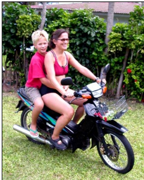
Øvelseskjøring på gressbakken foran Det rosa huset.

dermed kjørelisens for et halvt år, andre får kanskje bare for noen uker. Skulle du være i den kategorien som ikke har en A i ditt norske sertifikat, får du ikke kjøre moped (100 cc) før du har kjørt opp til ”moped-lappen”. Husets frue tilhørte denne kategorien og startet kjøreopplæringen på gressbakken foran Det rosa huset. Etter et møte med hekken og en del runder på gressplenen, dristet vi oss ut på stille bakveier for å øve på ”giring i fart”. Framgangen var påtagelig, selv om husets sønner hevdet at å sitte bakpå var som en ”nær døden opplevelse”. Etter noen dager var tiden inne for å kjøre opp til mopedsertifikatet. Av de lokale fikk vi vite at det foregikk på den måten at man kjørte rundt kvartalet til politistasjonen, mot klokken. Gjorde man det uten å velte og samtidig klarte å blinke til venstre, var det gjort. Vi gikk derfor opp ”løypa” to ganger og la opp til både å starte og kjøre på 2. gir for å slippe den plagsomme giringen. Politimannen som ledet seansen gav følgende enkle instruksjon før oppkjøringen: ”Her på øya har vi venstrekjøring, for det meste er det 40 km/t, og pass nå på at dere ikke velter!”. Deretter fulgte oppkjøringen som ganske riktig gikk til venstre rundt politistasjonen, - på 2. gir.