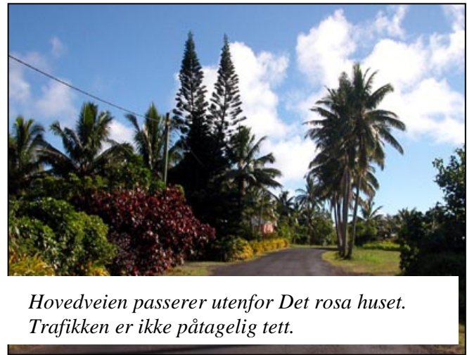
Hovedveien passerer utenfor Det rosa huset. Trafikken er ikke påtagelig tett.

Trafikk-kontroll er en sporadisk sak og ikke noe å frykte dersom man har et sertifikat å vise fram. Det var det de manglet de svenske jentene som hadde lagt en planke over salen på mopeden og laget sitteplass til alle fire! Sakte putret de blonde jenten på back-road under store mangotrær og palmer. Ryktet hadde opplagt gått langs veien og telefonene hadde nådd politistasjonen. Ikke lenge etter var øyas samtlige tre politimotorsykler på sporet etter de blonde jentene. Hvorvidt den